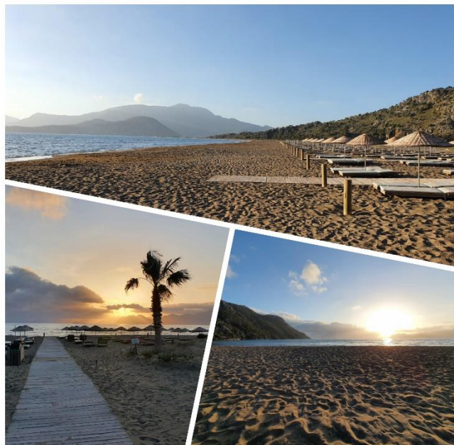
Dalyan: Iztuzu Beach